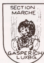
Das damalige Abzeichen der Sektion