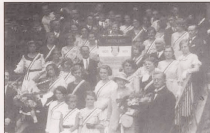
Unser Fahnenträger inmitten der Ehrenjungfern auf der Treppe der alten Schule (19.08.1934)