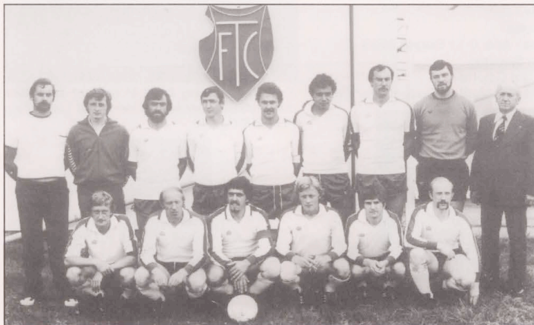
August 1979 «Soixentenaire» FC Tricolore