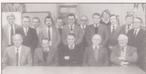
1984 Organisationsvorstand 65 FCT