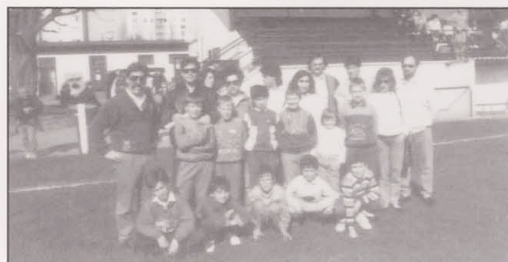
1989 Poussins in Tavernez