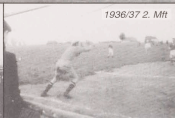
1936/37 2. Mft