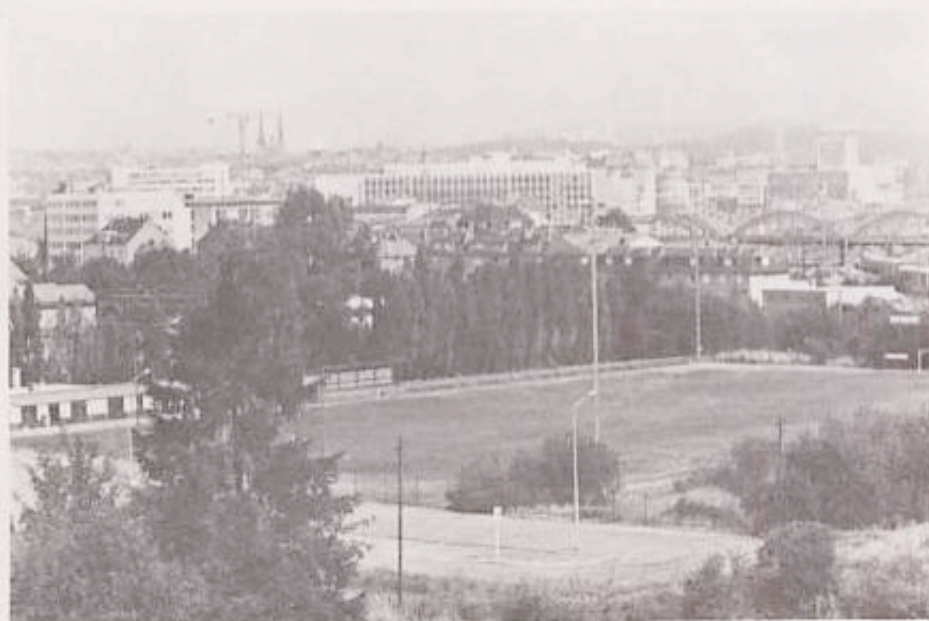
Neues Spielfeld Jacques Stas Straße