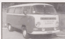
1981 1. Bus