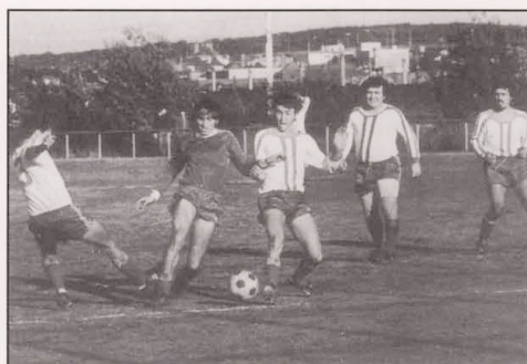
September 1977 Szene C. Lux: T - Aspelt 5-3