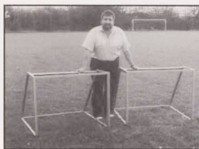
1992: "Dem Änder sei Wierk"