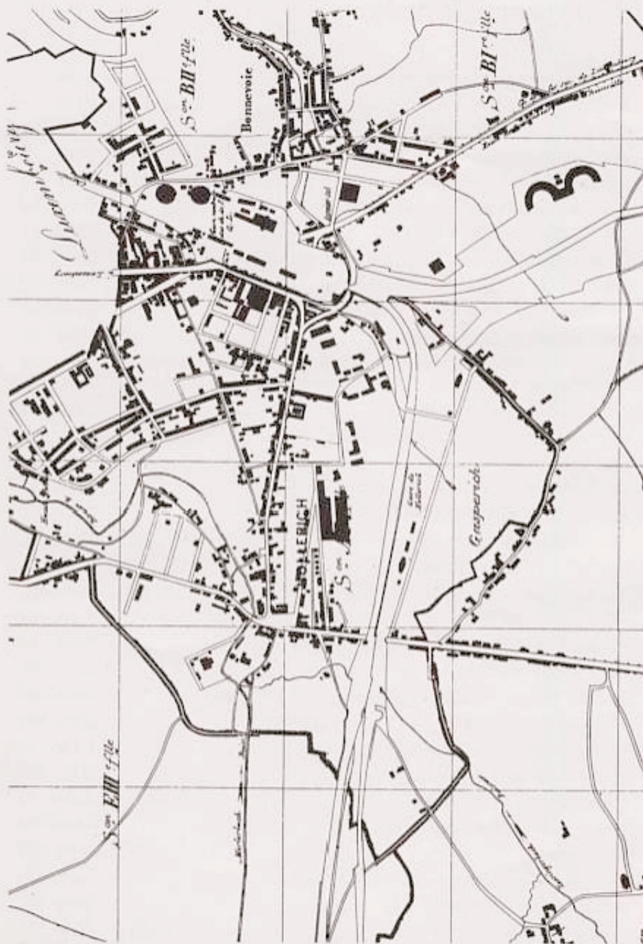
Auszug aus der Übersichtskarte der Katasterpläne der Gemeinde Hollerich, um das Jahr 1920 Maßstab 1:10.000