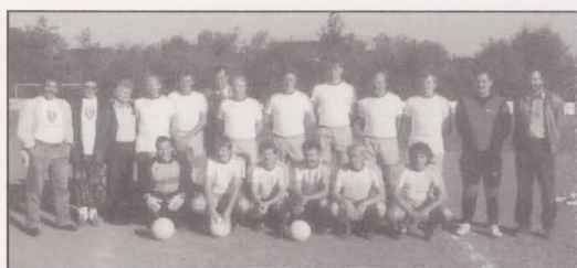
25.05.1990 Konveniat früherer Tricolore Spieler