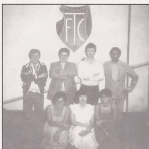
1981 Supporterclub † ALLEZ TRICOLORE