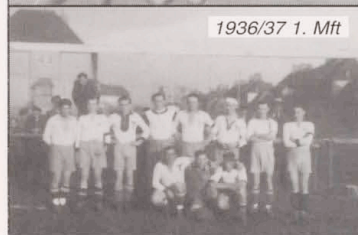
1936/37 1. Mft