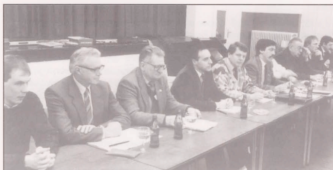
Vorstand 1989 während der Generalversammlung