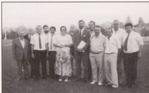
Nach dem Turnier .....