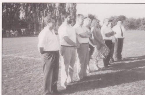
Vor dem Finale