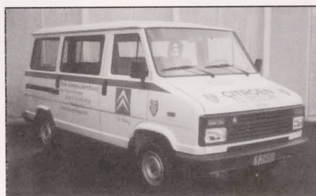
Neuer Minibus des Vereins geliefert am 31.10.1989