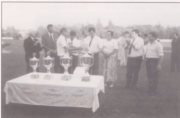
Empfang der Ehrengäste