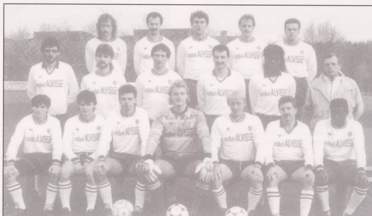
Die Meisterelf 1989/90

Nach einem weiteren 2-1 Sieg gegen Mühlenbach wurden wir von der Sportpresse als ernsthaften Aufstiegs kandidat gehandelt. Ein überzeugender 2-0 Sieg in Hostert (SCHOLTEN-ACKER) brachte uns erstmals die Führung in der Tabelle. Das 0-0 im Heimspiel gegen Merl entsprach erwartungsgemäss nicht unseren Vorstellungen. The National-T: 1-2 ein hart umkämpfter wichtiger Sieg gegen einen direkten Verfolger. Nach dem Ausscheiden aus der Coupe de Luxembourg (US Düdelingen-T: 3-0) trafen wir auf die Elf von Bettemburg. Die 100 Zuschauer erlebten ein selten schwaches Spiel, nur der 1-0 Sieg (STOLTZ) passte in unser Konzept. In Weimerskirch verschliefen wir die 2te Halbzeit mit viel Glück, gewannen trotzdem das Spiel mit 2-1. Somit waren wir ungeschlagen Herbstmeister .