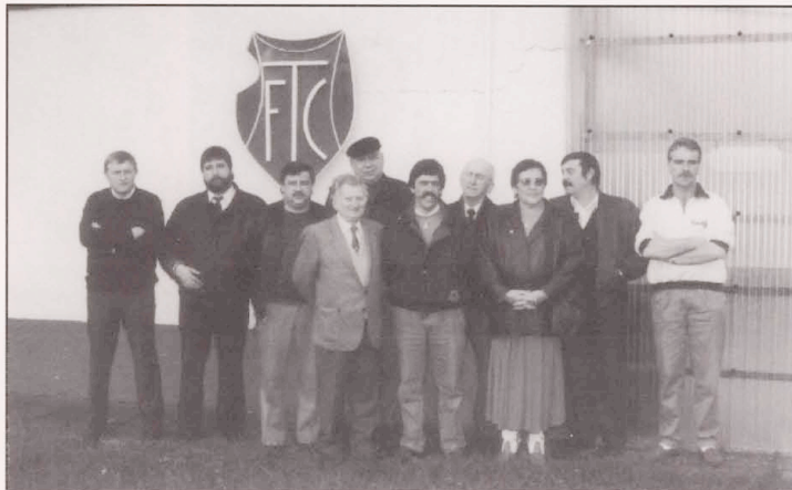
Der Vorstand bei den Vorbereitungsarbeiten