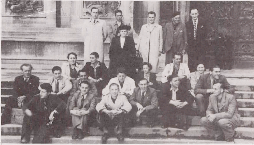
Gruppenbild in Mailand

An Ort und Stelle merkten die Gaspericher gleich, daß der Organisator über einen fabelhaften Reklamechef verfügt. Transparente waren über die Straßen gespannt, Plakate mit Balkenschrift kündigten das Spiel an. Verdutzte Gesichter gab es mit anschließendem piffigen Lächeln, da 5 Gaspericher, die es sich im Traume nie gedacht hätten, zu Nationalspielern promoviert worden waren.