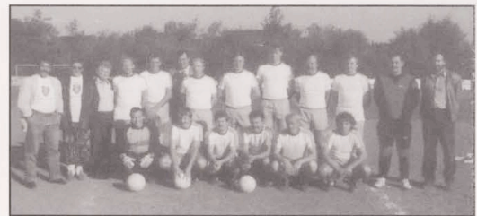
25.05.1990 Konveniat früherer Tricolore Spieler