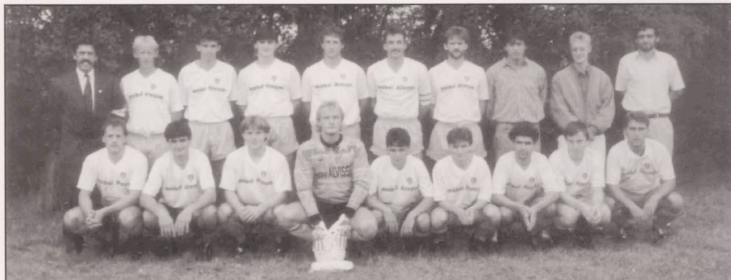
Tricolore Mannschaft Coupe STOLTZ