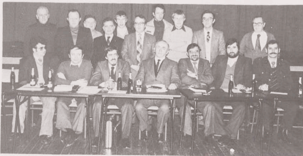
Vorstand: Jahr 1981